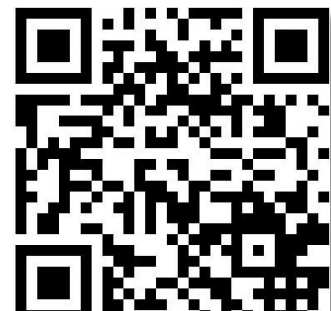
Termin auf dem Handy anzeigen:

Das Eisenbahnwesen-Seminar: Studierende, Absolventen und externe Referenten stellen eigene Arbeiten oder aktuelle Projekte vor. Ohne Anmeldung auch für externe Gäste. Informationen und Newsletter unter www.ews.tu-berlin.de